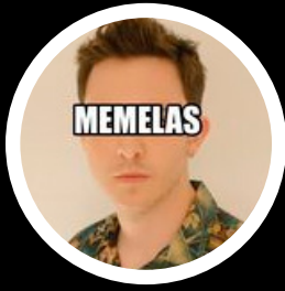
Memelas de Orizaba @memelasdeorizaba