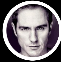
Mauricio Ochmann @mauochmann