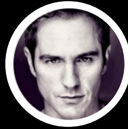
Mauricio Ochmann @mauochmann