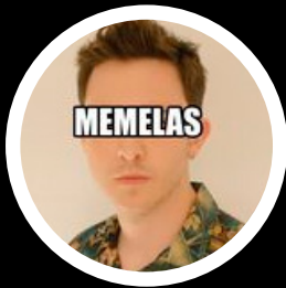
Memelas de Orizaba @memelasdeorizaba