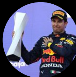
Checo Pérez @schecoperez