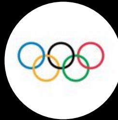
The Olympic Games @olympics