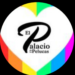
El Palacio de las Pelucas @elpalaciodelaspelucas