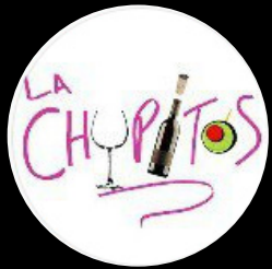
La Chupitos @_lachupitos