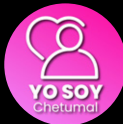
Yo Soy Chetumal @yosoychetumal