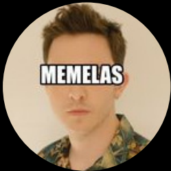
Memelas de Orizaba @memelasdeorizaba