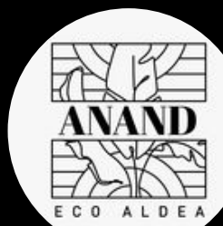
Anand Ecoaldea @anandecoaldea.mx