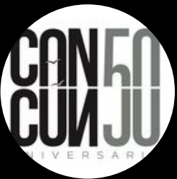
Cancún 50 @cancun50_