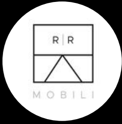
RR Mobili @rrmobili