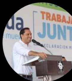
Mauricio Vila @mauvila